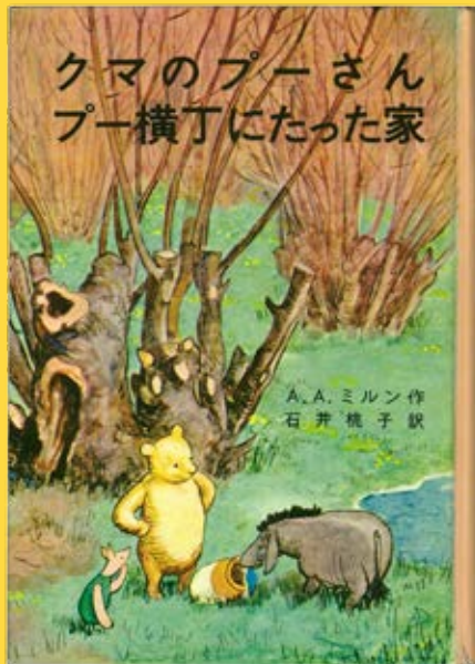
A. A. ミルン作 石井桃子訳『クマのプーさん プー横丁にたった家』岩波書店 1962年刊

ほつご ねん いしいももこてん 没後10年 石井桃子展 ほん よ 一本を読むよろこびー