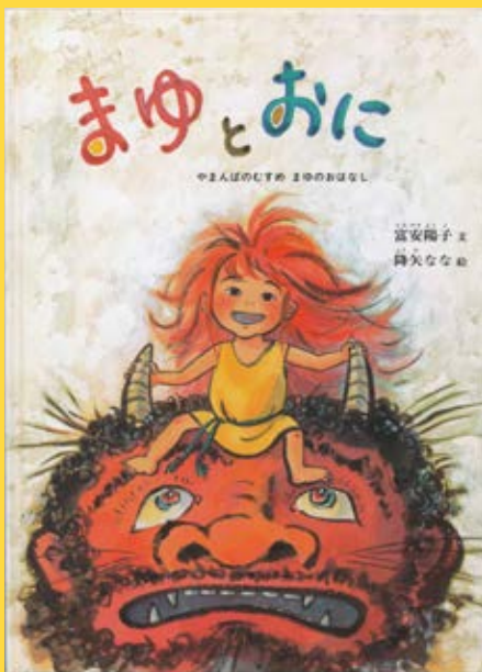
富安陽子・文 降矢なな・絵『まゆとおに』福音館書店

神奈川県鎌倉市長谷 1-5-3 TEL:0467-23-3911/FAX:0467-23-5952